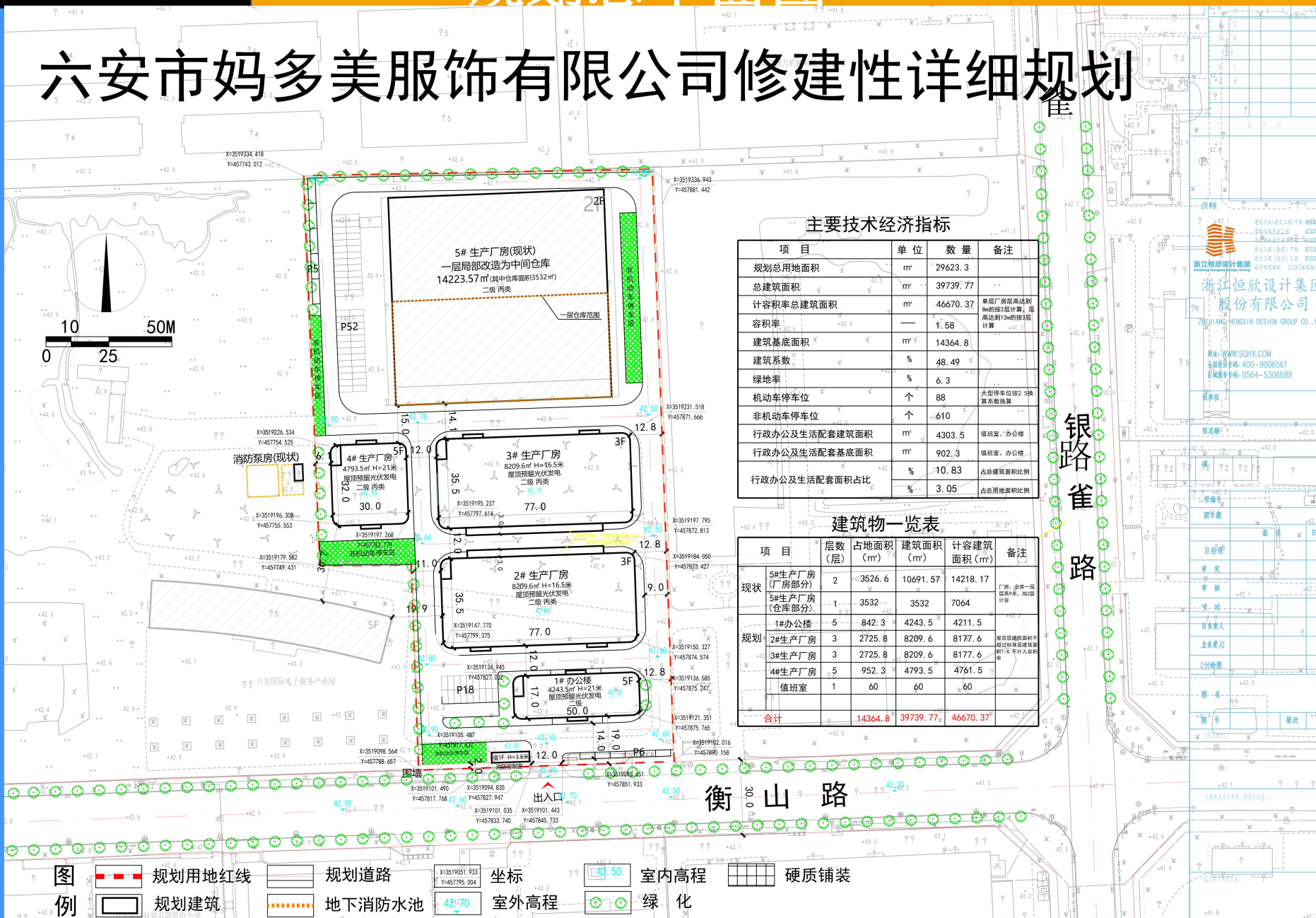
主要技术经济指标